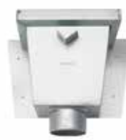
RHEINZINK Vergaarbak Vierkant

Artikelnummer 1640000550 (60 mm) 1640000700 (80 mm) 1640000801 (100 mm)