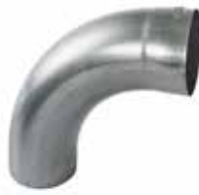
RHEINZINK WB bocht 85gr mof/spie*

Artikelnummer 1635000060 (60 mm) 1635000200 (80mm) 1635000400 (100mm)