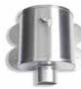
RHEINZINK WB vergaarbak Amsterdam

Artikelnummer 1635000210 (80 mm) 1635000455 (100 mm)