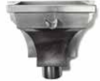
RHEINZINK WB vergaarbak Den Bosch

Artikelnummer 1640000325 (60 mm) 1640000400 (80 mm) 1640000501 (100 mm)