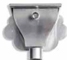
RHEINZINK vergaarbak Oud Hollands

Artikelnummer 1640000450 (80mm) 1640000525 (100 mm)