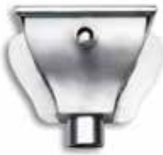
RHEINZINK WB vergaarbak Haarlem

Artikelnummer 1640001200 (80 mm) 1640001300 (100 mm)