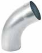
RHEINZINK WB bocht 60gr mof/spie

Artikelnummer 1635000100 (80mm) 1635000300 (100mm)