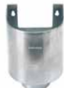
RHEINZINK vergaarbak Mini met uitsparing

Artikelnummer 1640001000 (60 mm) 1640001100 (80 mm) 1640001156 (100 mm)