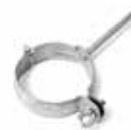
Gegalvaniseerde scharnierpijpbeugel met slagpen voor stalen ondereind ** Artikelnummer 2840001800 (60 mm) 2840000900 (70 mm) 2840001000 (80 mm) 2840001100 (100 mm)