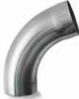
RHEINZINK WB bocht 72gr mof/spie*

Artikelnummer 1635000050 (60mm) 1635000207 (80mm) 1635000307 (100mm)