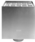
RHEINZINK WB vergaarbak Kubus met rooster

Artikelnummer 1640000875 (80 mm) 1640000877 (100 mm)