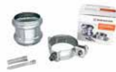
RHEINZINK HWA-buis bevestigingsset

Artikelnummer 1631000375 (1m) 1631000300 (2m)** 1631001300 (3m)**