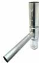
RHEINZINK hemelwa- teropvang met vaste vulbuis Artikelnummer 1635001542 (80 mm) 1635001543 (100 mm)