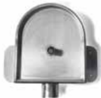
RHEINZINK vergaarbak Oud Amsterdam

Artikelnummer 1640000450 (80mm) 1640000525 (100 mm)