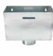
RHEINZINK vergaarbak Trapezium

Artikelnummer 1640000050 (60 mm) 1640000200 (80 mm) 1640000301 (100 mm)