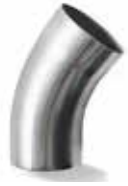
RHEINZINK WB bocht 40gr mof/spie*

Artikelnummer 2840009400 (60mm) 2840009500 (80mm) 2840009600 (100mm)