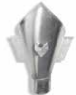
RHEINZINK vergaarbak Trechter

Artikelnummer 1640000890 (60 mm) 1640000900 (80 mm) 1640000911 (100 mm)