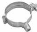
Gegalvaniseerde schar- nierpijpbeugel met moer M8/M10 Artikelnummer 2840001010 (80 mm) 2840001020 (100 mm)