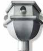
RHEINZINK WB vergaarbak Louvre

Artikelnummer 1640001551 (80 mm) 1640001561 (100 mm)