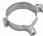
Gegalvaniseerde schar- nierpijpbeugel 82mm met moer M8/M10 Artikelnummer 2840001040 (82 mm)